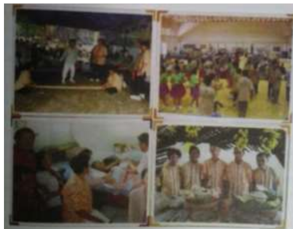
Figure 1: Activity from short plan (3 months) (Kewali Kruejak and Soontaree Suratana, 2015: p.165)